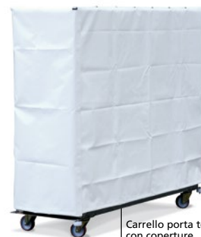
Carrello porta telai con coperture Stainless steel trolley with hoods

Coperture per carrelli porta telai Hoods for oven-frame trolley