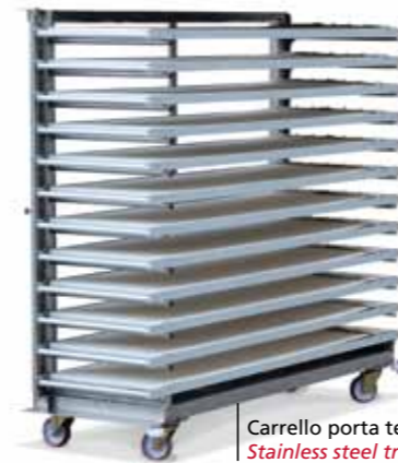
Carrello porta telai Stainless steel trolley