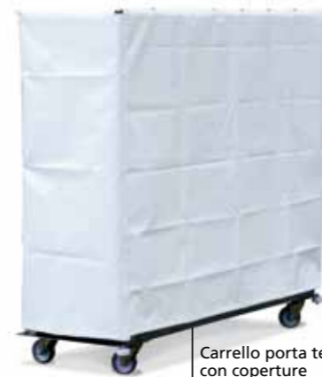
Carrello porta telai con coperture Stainless steel trolley with hoods